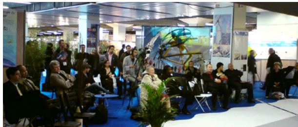
Espace énergies marines «Planète bleue»