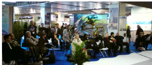
Espace énergies marines «Planète bleue»